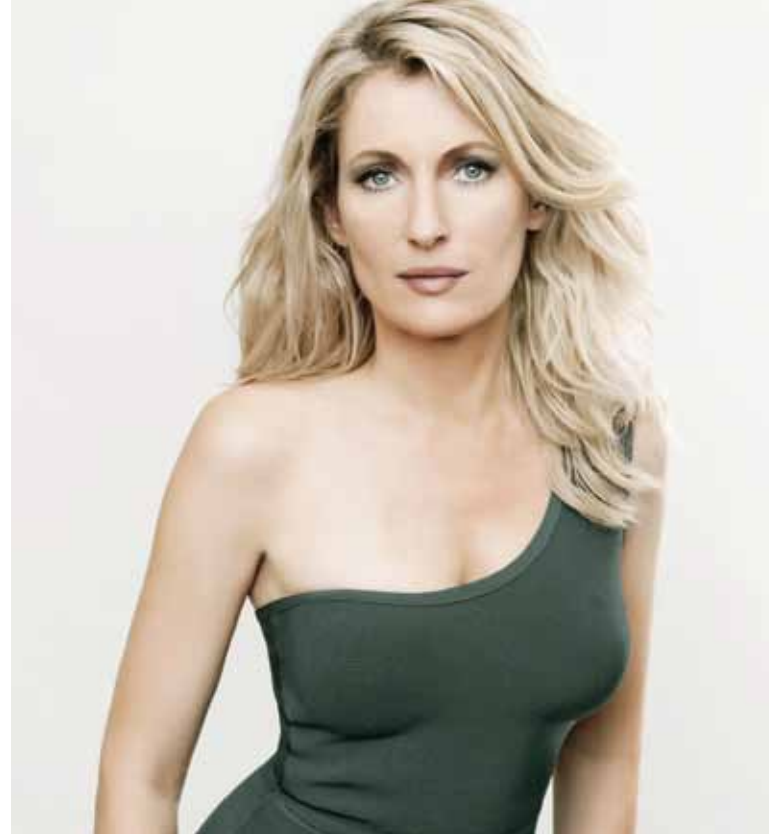
Psychologin Maria Furtwängler: „Ich habe die Fähigkeit zu analytischer Klarheit und der damit verbundenen Gelassenheit.“

U nd wie bringt sie nun ihre vielen Rollen als Mutter, Frau, Kommissarin, Konferenzmanagerin oder helfende Ärztin unter einen Hut? Ist Maria Furtwängler die Erfindung von Multitasking? „Ach was, ich bin das Fleisch gewordene Burn-out-Syndrom“, lacht sie und legt nach: „Mein Galgenhumor rettet mich vor zu viel Belastung.“ Und wenn morgen Hollywood ruft? „Dann möchte ich mit Meryl Streep spielen. Die finde ich großartig.“ Doch sie müsse da nicht hin, das sei kein Ziel, was sie habe. „Ich sehe mich als jemanden, der sich aus dem heraus entwickelt, was da ist. Der heimische Filmmarkt ist reizvoll, und ich möchte tolle Geschichten und schöne Filme machen.“ Dr. Maria Klartext. Einfach, direkt, authentisch. Rund um den jüngsten Geburtstag ist sie in die Berge gezogen, „weil man beim Wandern und Laufen am besten bei sich ist. Absolut. Ich habe tolle Touren gemacht und Glückseligkeit gefunden. Es gab Blicke auf Berge, Abgründe und Täler, wo ich dachte: Ach, ist das Leben schön.“