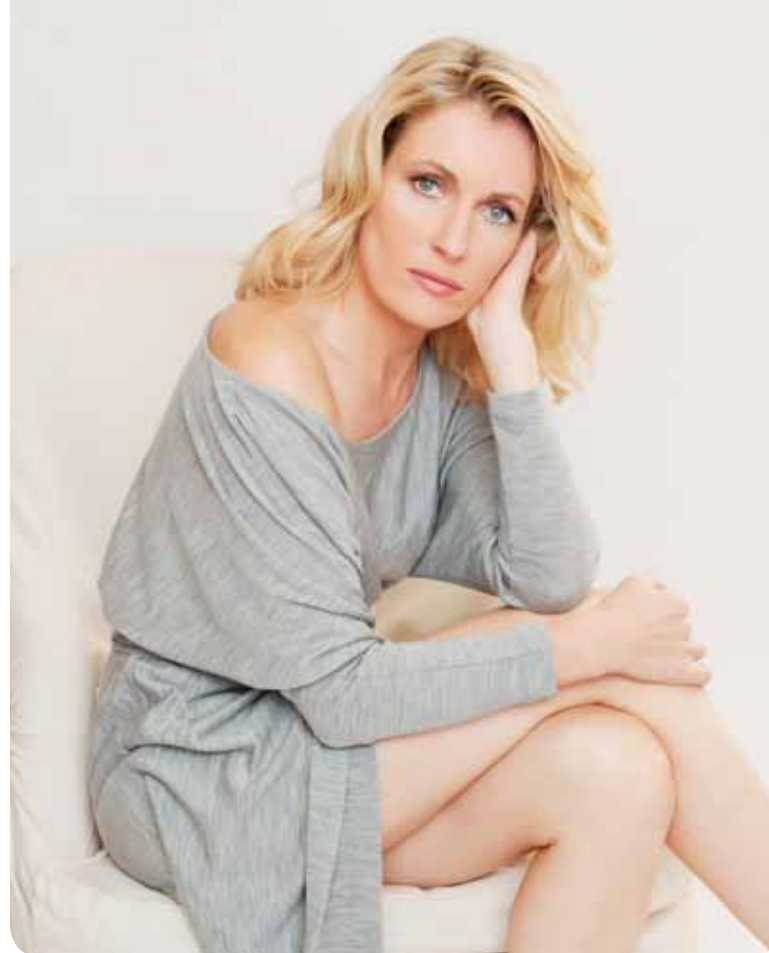
Bergsteigerin Maria Furtwängler: „Da gib’t’s Glückseligkeit. Blicke auf Berge und Täler, wo ich denke: Ach, ist das Leben schön.“

Maria Furtwängler ist seit 2002 Charlotte Lindholm, die Einzelkämpferin des LKA Niedersachsen aus Hannover, und erfolgreichste „Tatort“-Kommissarin. Die von Gerechtigkeit besessene Ermittlerin häutet sich gerade: Lindholm ist wie ein Backfisch verliebt, begeht Ermittlungsfehler und: bleibt einsam.